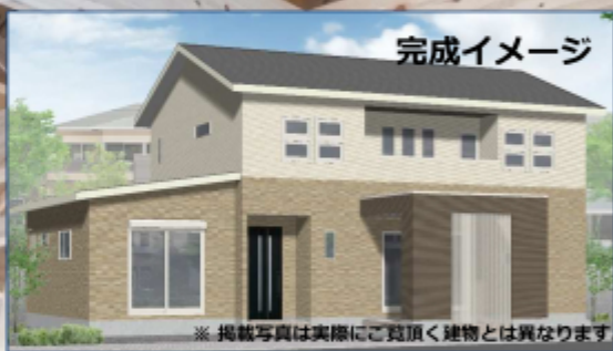
※掲載写真は実際にご覧頂く建物とは異なります。

1F床面積 : 96.05m 2 (29.00坪) 2F床面積 : 55.68m 2 (16.81坪) 延床面積 : 151.73m 2 (45.81坪)